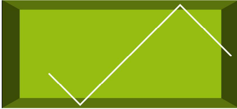
Figure 2 : Schématisation de la correction acoustique