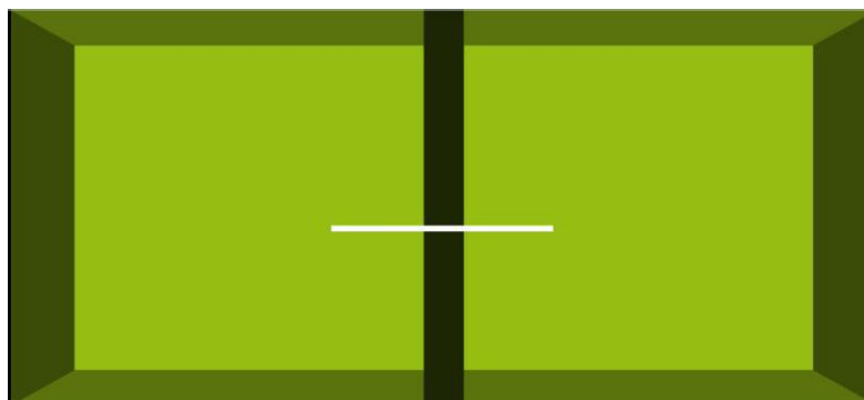
Figure 1 : Schématisation de l'isolation acoustique

On parle d'isolation acoustique lorsqu'on cherche à limiter les bruits émis à l'extérieur du local à protéger.